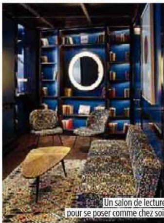
Un salon de lecture pour se poser comme chez soi.

L'esprit. Celui d'une maison parisienne chic, résolument déco avec jeux de miroirs, salon cosy, cheminée et une