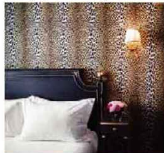
D'audacieuses associations de motifs habillent chambres (en haut) et couloirs.